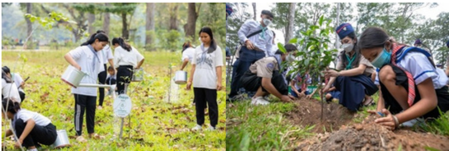
Nous enseignons à notre jeune génération à donner en retour à notre planète par le biais de diverses activités, l'une d'entre elles étant la plantation d'arbres.

Tout au long de l'année, notre Organisation membre organise des activités axées sur cinq thèmes clés : l'éducation, l'environnement, la santé et la sécurité, la culture, l'art et l'artisanat, et les activités d'engagement. Ces activités offrent aux jeunes filles défavorisées la possibilité de vivre et de profiter des mêmes avantages que la plupart des filles de leur âge. Nous sommes déterminées à concrétiser la vision Boussole 2032 : "Un monde égalitaire où toutes les filles peuvent s'épanouir".