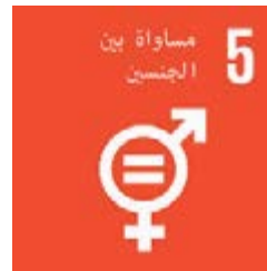
الهدف الخامس: المساواة بين الجنسين