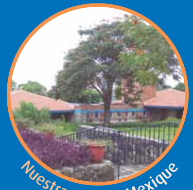
Nuestra Cabaña Mexique