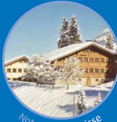
Notre Chalet Suisse