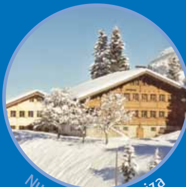
Nuestro Chalet Suiza