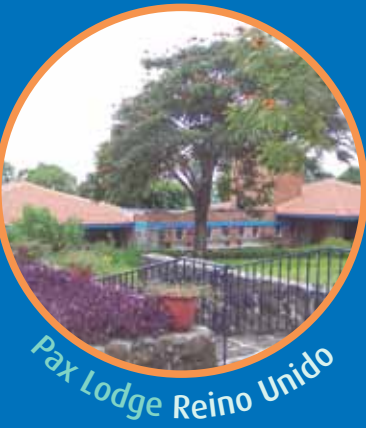
Pax Lodge Reino Unido