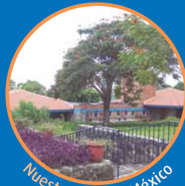
Nuestra Cabaña México