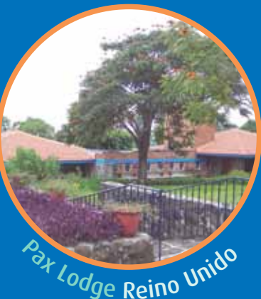
Pax Lodge Reino Unido