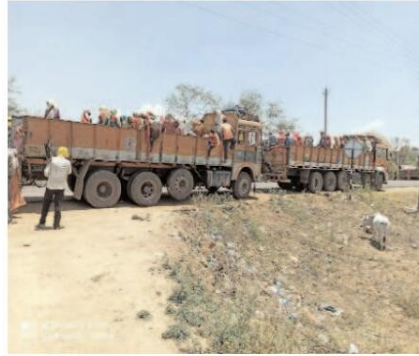
जबलपुर . भारत स्काउट एवं गाइड द्वारा जबलपुर संभाग के जिला मंडला के विकासखंड नैनपुर में आई को महाराष्ट्र से हाथ आए